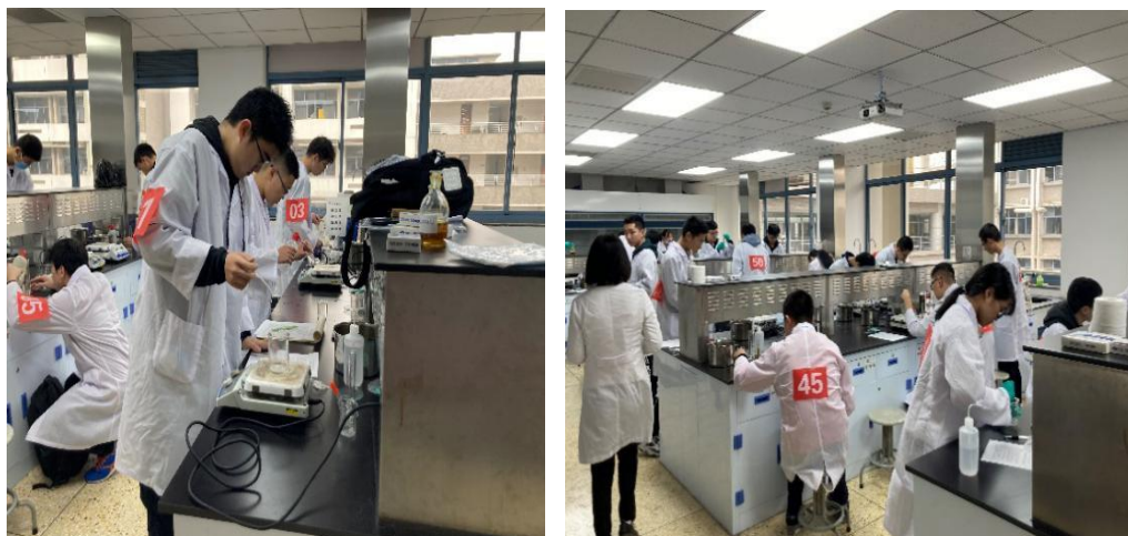
第八届“宏坤·银杏杯”化学知识竞赛复赛现场